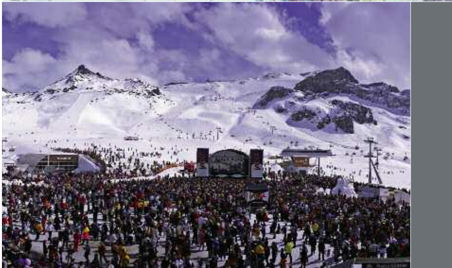
Ischgl constitue avec Samnaun la Silvretta Arena, un domaine skiable qui se partage entre l'Autriche et la Suisse. Les fameux concerts hivernaux à Idalp (2 320 m) réunissent des milliers de skieurs.

L'aspect le plus frappant, ce sont les bâtiments : tous récents, modernes et d'une architecture soignée, comme si le village n'avait que quelques années. Les constructions qui paraissent plus vieilles se comptent sur les doigts d'une main, car, effectivement, chaque année le village est maintenu à neuf au prix d'un important chantier estival. Autre point impressionnant, le nombre d'hôtels quatre étoiles