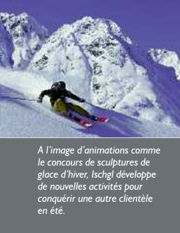
A l'image d'animations comme le concours de sculptures de glace d'hiver, Ischgl développe de nouvelles activités pour conquérir une autre clientèle en été.

qui bordent les rues : 67 % des lits hôteliers appartiennent à des établissements de cette catégorie. Les logements en hôtels (qui, pour une grande partie, offrent la demi-pension) et autres auberges et pensions représentent d'ailleurs 61 % du total des lits marchands. Au rez-de-chaussée d'une grande partie des bâtiments sont édifiés des bars d'après-ski, afin que les fêtards puissent commencer les festivités sitôt après avoir déchaussé. Mais l'abondance des uns crée la pénurie des autres.