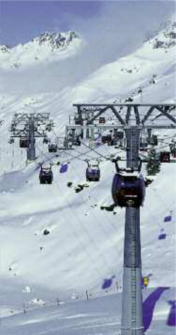
Les 20 millions d'euros annuels uniquement consacrés au domaine skiable justifient la modernité des installations.

étable, il semblerait qu'une partie des paysans se soient partiellement reconvertis en hôteliers, sans qu'on trouve dans la station une grande tradition hôtelière comme il en est question à Zermatt, par exemple. Ainsi, seuls cinq hôtels sont exploités par des sociétés, tous les autres appartenant à des familles. Une certaine mentalité paysanne perdure donc, notamment aussi avec quelques difficultés à s'adapter à la réservation en ligne ou au paiement par carte de crédit, même si le village, les hôtels et les boîtes de nuit font réellement preuve de modernité et de style.